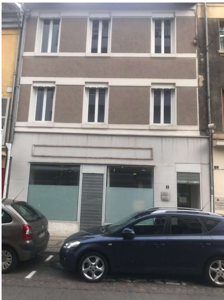
CATTP « Le point du soir » 4 Avenue du régiment de Bigorre - 65000 Tarbes Secrétariat : 05.62.99.54.40

Le CATTP accueille sur prescription médicale les : lundi de 17h à 19h, mardi de 17h à 19h, mercredi de 14h à 18 h des adolescents de 12-18 ans souffrant de troubles psychologiques.